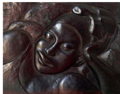
Tête de Moure Fusta 25 x 32,5