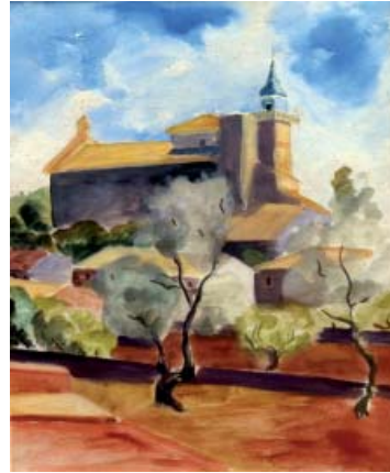
La Cartoixa de Valldemossa Aquarel·la 32 x 23

Acaba amb la seva vida a la casa de Gènova. El 15 de maig es va publicar la seva esquela en el Correu de Mallorca.