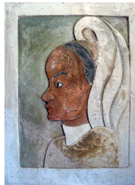
Perfil de dona Escaiola Policromada 40 x 28,5