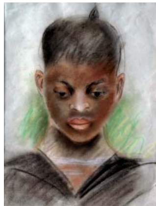
Nin Pastel 27 x 22

La sombre del valle densa y estática era emoción que yo recojí en silencio. Cuando tocaban en la tarde las campanas de la Cartuja, fallecía de tristeza.