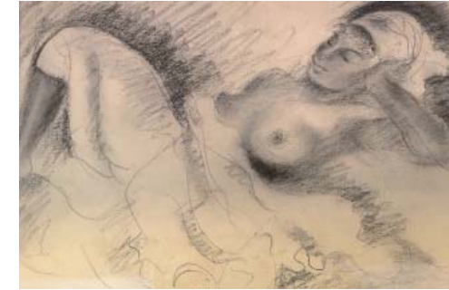
Dona tombada Carbò 21 x 30

La sombre del valle densa y estática era emoción que yo recojí en silencio. Cuando tocaban en la tarde las campanas de la Cartuja, fallecía de tristeza.