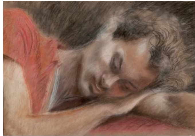
Retrat de Fred O'Hara Pastel 39 x 52