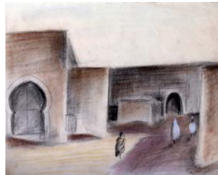
Paissatge del Marroc Pastel 21 x 28