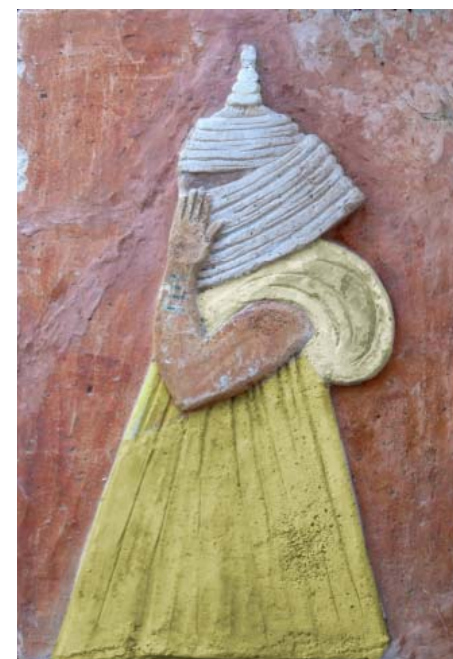
Figura de perfil Escaiola Policromada 42 x 28,5