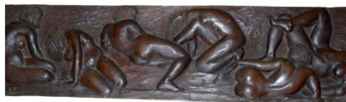
Postures Fusta 25 x 115