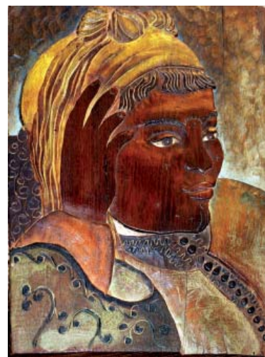
Dona del Marroc Fusta Policromada 33x25