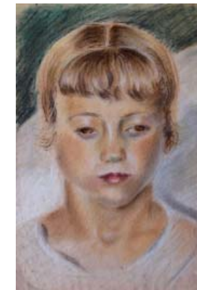
Nina Pastel 27 x 19

Con el lápiz en la mano, me siento en todo mi aplomo. Pierdo timideces y susceptibilidades. Alcanzo una serenidad tan grande que es casi felicidad.