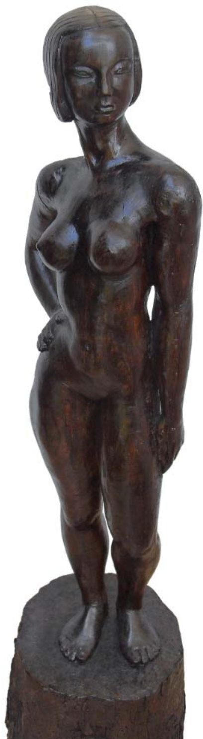
Nu Fusta 115 x 25