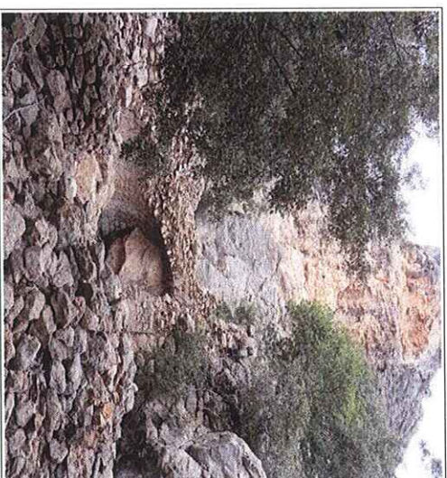
Figura 2. Font de sa Gruta amb el seu estat actual.