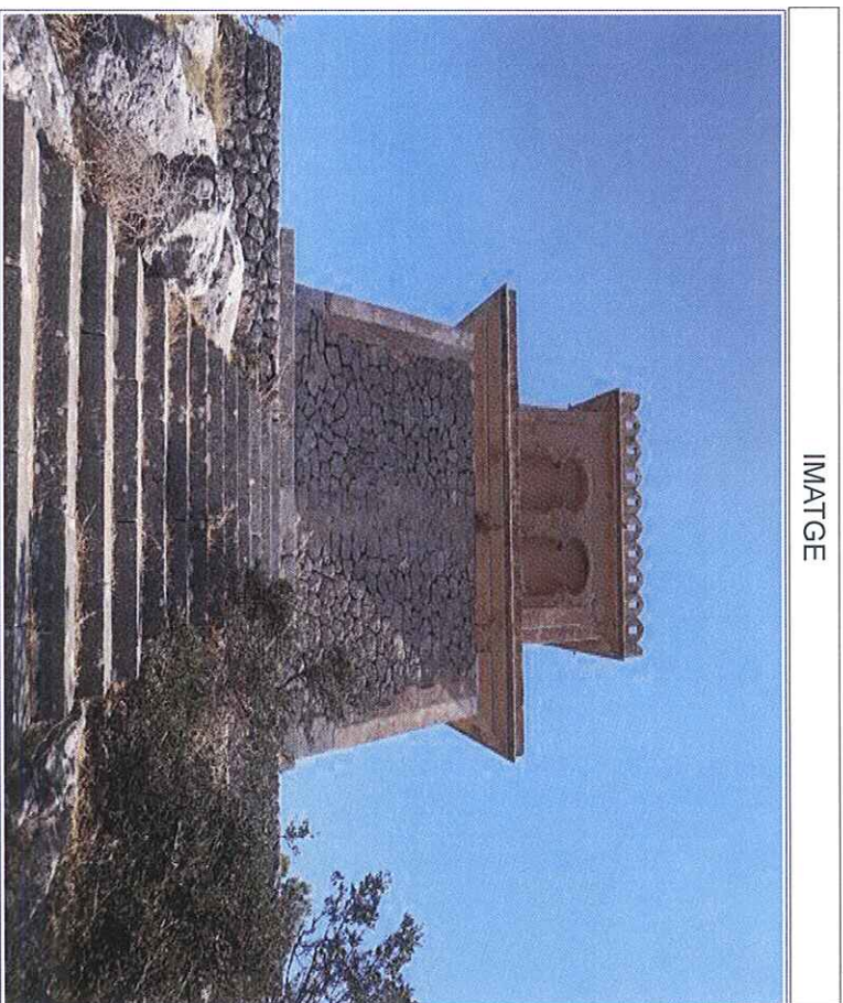
Figura 1 Puig de sa Monedà.